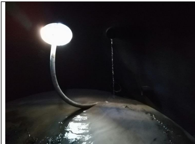
Retiro de lodos del fondo de la cuba